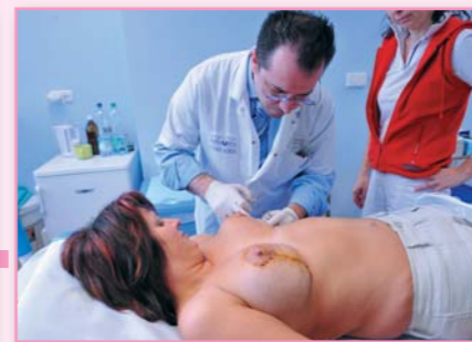
Vyndávání stehů po dvou týdnech