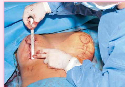
Operace je u konce, lékař kontroluje souměrnost jizvy po sešití.