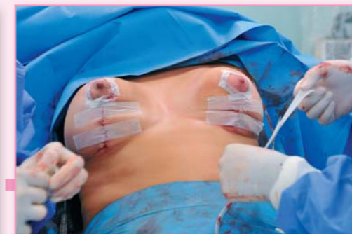
Závěrečná fáze: zalepování stehů