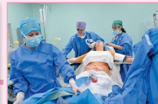
Hotovo, na řadě je bandážování