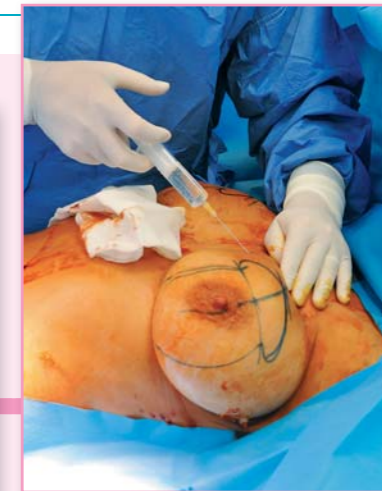
Speciální roztok minimalizuje krvácení při operaci a tlumí bolest