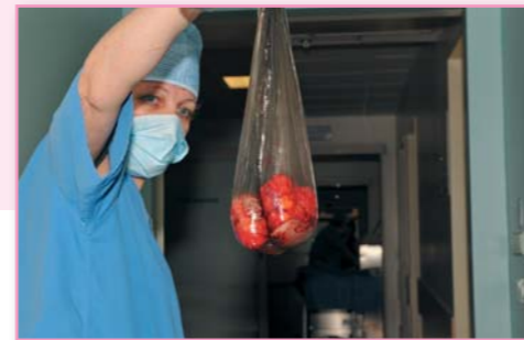
Z každého prsu bylo odebráno cca 260 g tkáně