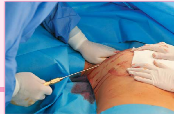
Začíná se liposukcí, část tukové tkáně se musí odsát

„Jizvy ve žláze budou minimální. Touto technikou je dokonce možné kojení, takže lze zmenšovat prsa i ženám, které dosud nerodily a chtějí dítě kojit,“ říká chirurg. „Při klasické metodě vypadají prsa sice ihned po zákroku lépe, ale kojení je omezeno, ne-li přímo znemožněno, a ani efekt není tak trvanlivý,“ podotýká dále. Zbylá žláza se fixuje k prsnímu svalu – a na rozdíl od standardní operace, při níž nejvíc krvácí právě žláza, zde ke krvácení prakticky nedochází. Vzniklý „pomeranč“ je třeba zase spojit dohromady a žlázu pozvednout, aby byl efekt pozvednutí trvalejší. Ke konci operace mají prsa pyramidový tvar, ale během jednoho měsíce si „sednou“ a případné drobné nerovnosti se vyhladí.