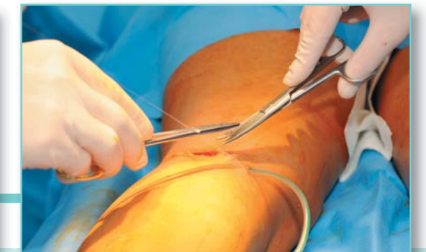
Rána téměř nekrvácí, cévky jsou "zastaveny"