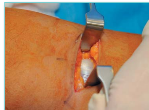
Hotovo - výplň je na svém místě