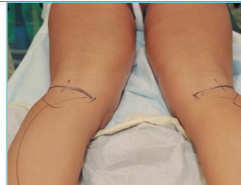
Nejprve je třeba provést nákras

Implantáty jsou usazeny na místě a tvar lýtek vypadá už teď velmi dobře. K sešití použije chirurg materiál, který se pozvolna