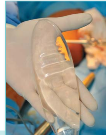
Implantát má vejčitý tvar a je na něj doživotní záruka