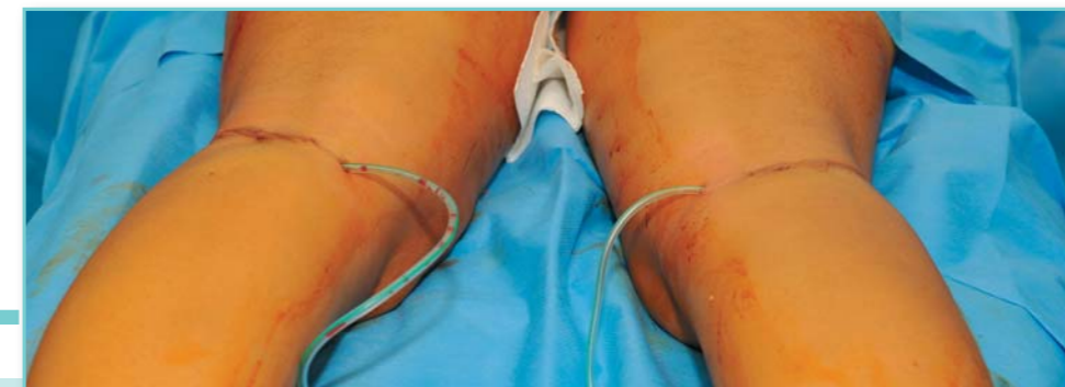
Speciální drén odsávající sekret bude vyjmut až při propuštění pacientky