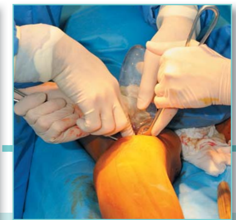
Implantát se vkládá mezi svaly, aby nebyl hmotný