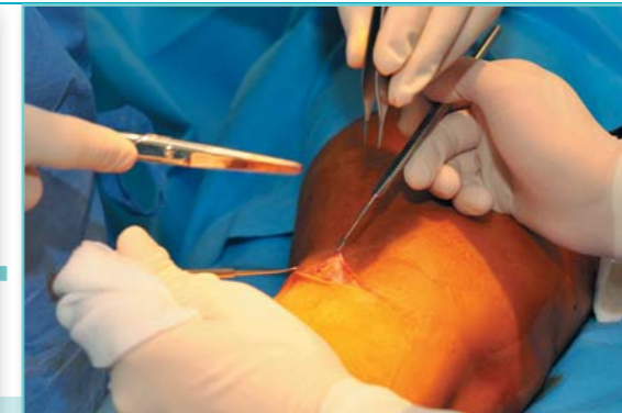
V podkožní jamce provede chirurg krátký řez a vypreparuje dutinu pro implantát