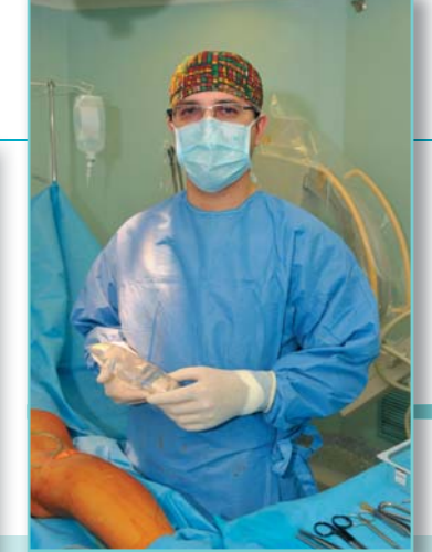
Do dutiny vloží lékař implantát