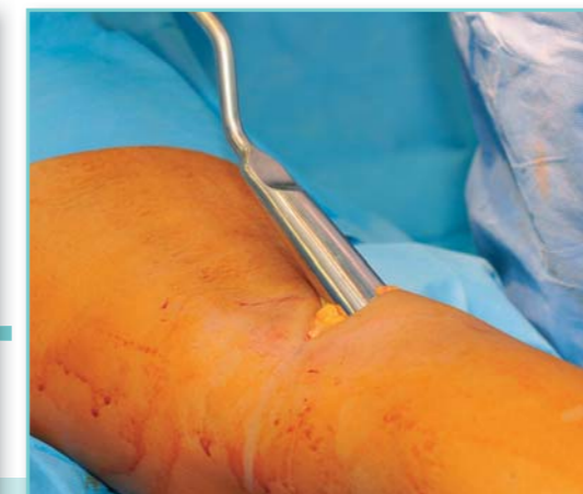
Speciální lopatka poslouží ke vsunutí implantátu