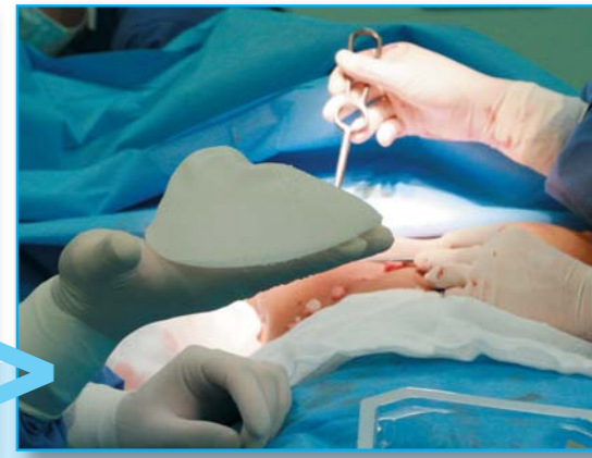
Jana dostane nové anatomické implantáty, tím ale zákrok nekončí...