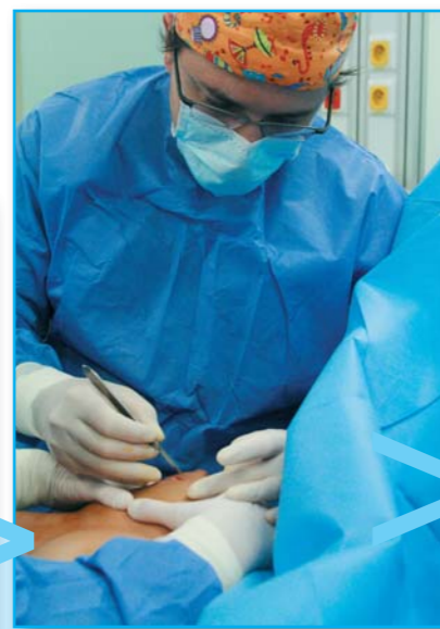
Lékař otevírá starou jizvu podél dvorce...