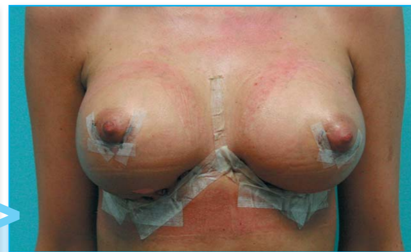
Prsa se hojila dobře a k žádným komplikacím nedošlo