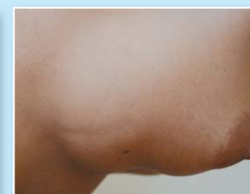
V předklonu jsou viditelné varhánky a nerovnosti