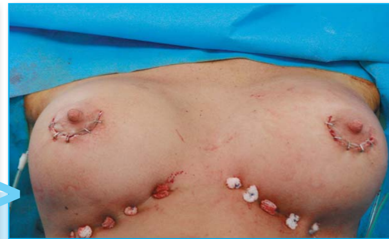
Novou podprsni rýhu vytvořil lékař částečně z vnitřní jizvy a zbytku svalu