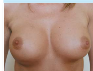
Příliš široké implantáty nebyly pro Janin úzký hrudník vhodné a pravý prsní sval atrofoval. Implantát tlačil Janu celých devět let

„Pan doktor mi průběh operace podrobně vylíčil. Škoda, že jsem o riziku velkých implantátů nebyla informovaná před devíti lety, byla bych si ušetřila hodně trápení. Ženy, které se pro augmentaci prsů rozhodnou, by se měly lékaře na všechno zeptat a nenechat se odbýt desetiminutovou konzultací jako tehdy já. Mně atrofovaly nejen prsní svaly, ale i mléčná žláza, takže kdoví, jestli budu ještě někdy kojit.“