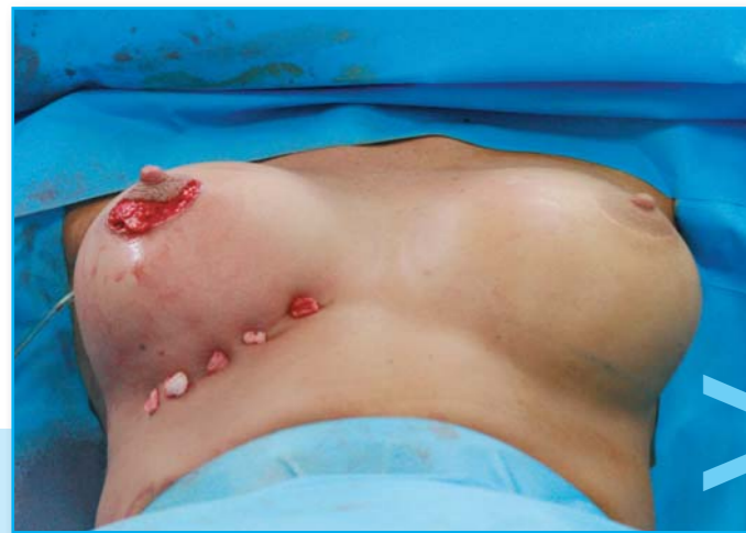
...protože je třeba vytvořit novou podprsni rýhu a tím zrušit "kapsu" a prs zpevnit