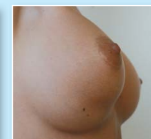
Při vzpažení vypadá prs jako přepůlený a implantát lze i nahmatat