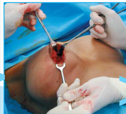
...a touto cestou se dostává k původnímu implantátu