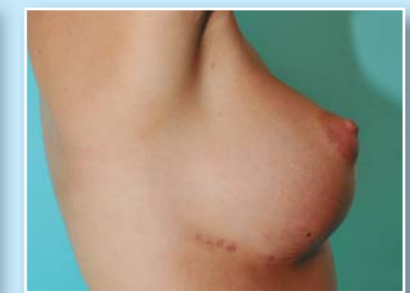
Prs působí přirozeně, implantát je nehmátný. Jana i operující lékař jsou spokojeni