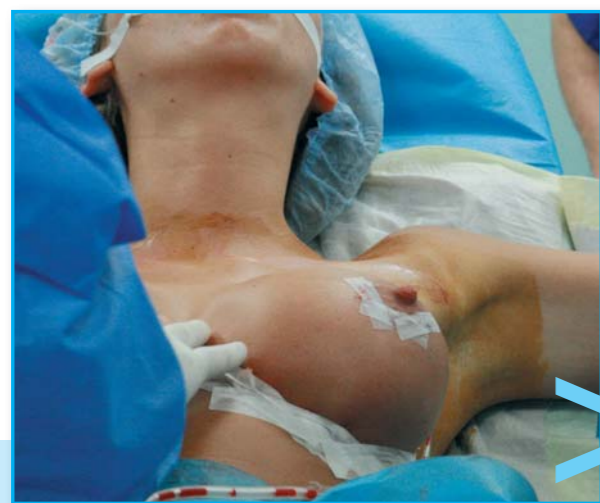
Zákrok se podařil, nové implantáty působí mnohem přirozeněji