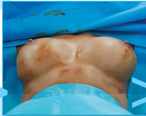
Řezy budou vedeny podle přesného nákresu. Žlábek mezi prsy se téměř nedá rozeznat